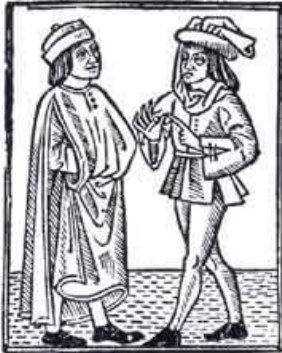
Ilustración 4, arriba. Maestro-Alumno medieval