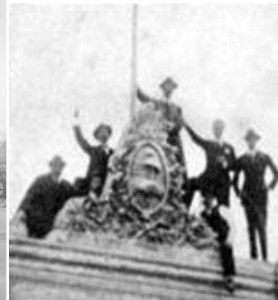
Ilustración 6, arriba. Estudiantes en la cúspide de la Casa de Trejo, sede de la UNC, Universidad de Córdoba, Argentina, dando inicio en junio de 1918 a la Reforma Universitaria, Foto: www.taringa.net