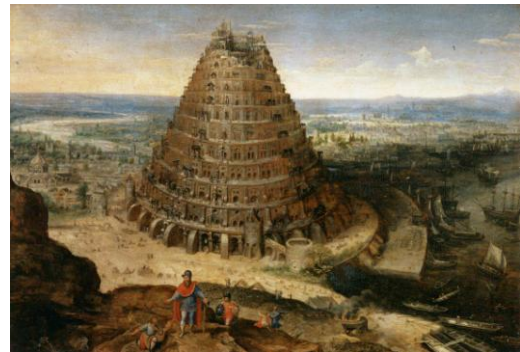
Ilustración 3, arriba. La Torre de Babel, por el artista holandés Lucas van Valckenborch (1535-1597)