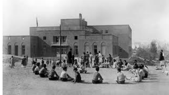
Ilustración 5, arriba. Práctica educativa basada en el enfoque del Instituto de Enseñanza Libre en España.