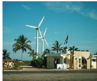
Ilustraciones 7 y 8, Izquierda. Mapeo con comunidades andinas en Perú y Centro para el Desarrollo de la energía eólica en Cuba. Fotos: ARC•PEACE.