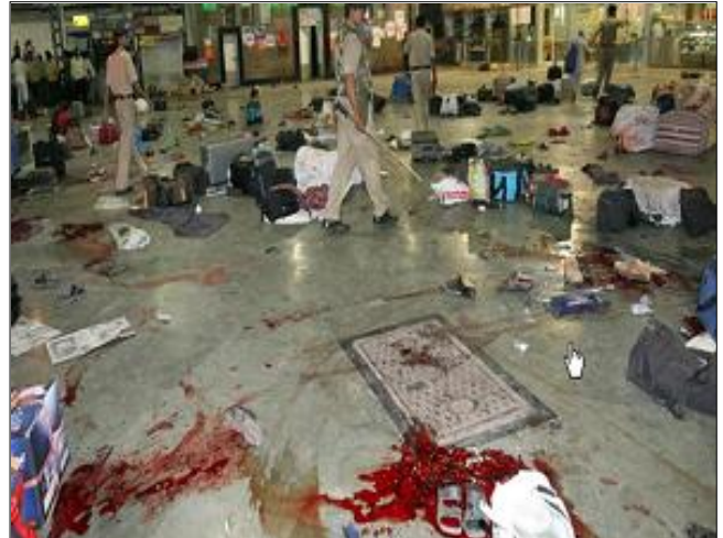
Vestigios ensangretados del ataque de Mumbai del 26 de noviembre 2008

El programa del Global Centre for Excellence (Centro Mundial para la Excellencia) del Disaster Prevention Research Institue (Instituto Investigativo para la Prevención