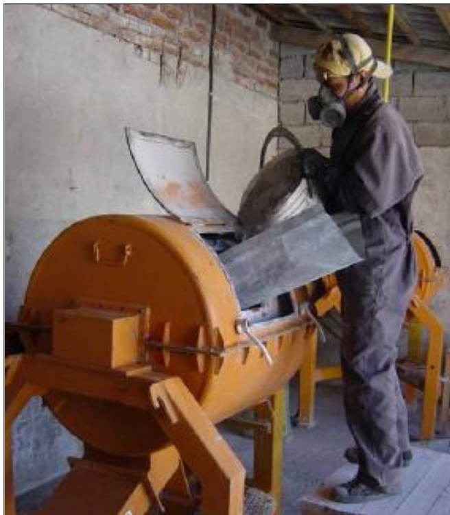
Mezclando una combinación cal-puzolana en la estación de investigación de Santa Clara, Cuba.

La conferencia atrajo más de 200 participantes de todo el mundo. Su mayoría venía de países latinoamericanos. También fueron representados España, Italia, el Reino Unido, Alemania, Grecia, Suecia y la República Checa. Algo como unas 180 ponencias fueron presentadas. Trataban de temas tales como la gerencia de las reservas naturales protegidas, el sustento de asentamientos rurales, densidades en áreas urbanas, diseño ecológico, turismo ecológico, construcciones anti-huracanes, sustento económico y la enseñanza de urbanismo.