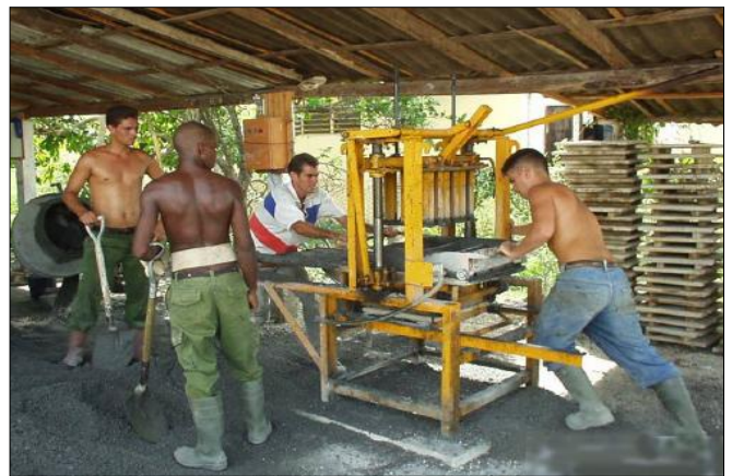
Producción de Bloques huecos a base de mezclas cal-puzolana